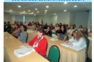
Participantes da Jornada